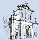
PARROCCHIA SS. NAZARO E CELSO